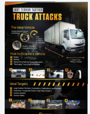
Revue de propagande de l'État Islamique publiée en mai 2017

De façon générale, on notera que les modes opératoires employés lors des dernières attaques en Europe répondent aux injonctions de la mouvance jihadiste qui promeut la tuerie de masse en Occident par tout moyen :